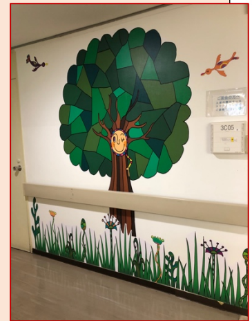
病棟のシンボルツリーに！