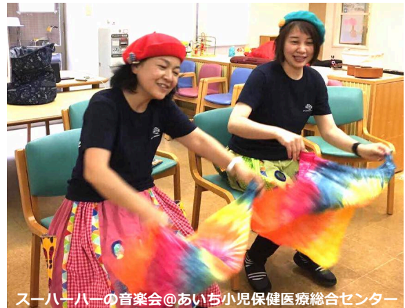
スーハーハーの音楽会@あいち小児保健医療総合センター

新緑のあとの紫陽花がみずみずしい季節となりました。 ニュースレター6月号をお届けします。 この3ヶ月も色々なことがありました。 3月24日に、全国のアーティスト、アシスタント、 事務局ボランティアが一堂に会したSHJ研修&交流 会を開催しました。回を増すごとに参加者が増え、 活動の広がりと発展を実感した1日でした（報告→）。 3月にSHJテーマソングが、5月には紹介動画も完成 し、youtube配信中です（紹介→）。 オンライン寄付サイトGive Oneの厳しい審査も通 り、現在新登録団体対象キャンペーン実施中です。 別紙を参照の上、ぜひご協力ください。