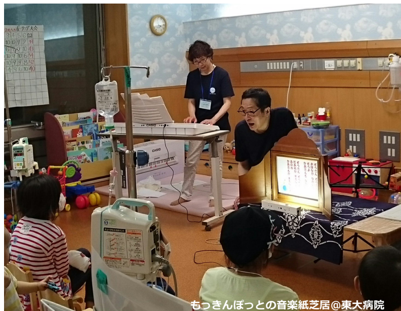
もつきんぼっこの音楽紙芝居@東大病院