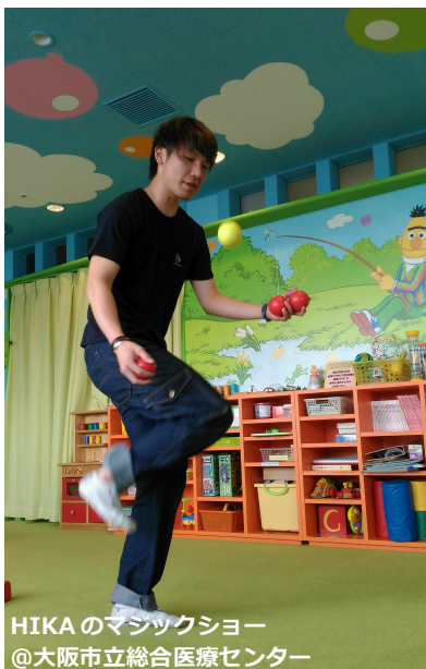
HIKAのマジックショー @大阪市立総合医療センター

みなさまからのご支援はアーティストの抗体検査、 謝金などの活動費に使わせていただいています。 3～5月は延べ 2,339 人の子どもたちとご家族に 笑顔を届けることができました。 活動報告をご覧ください。